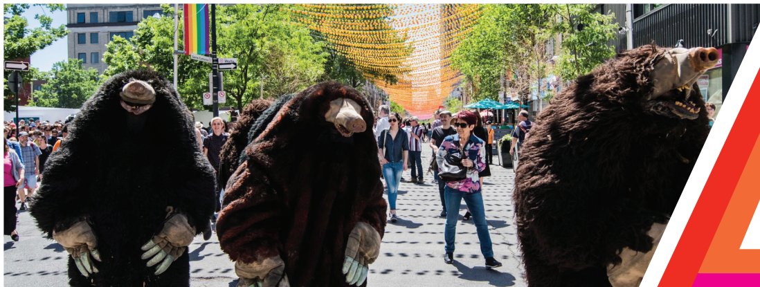
La parade des taupes

Relations de presse : Isabelle Longtin Roy & Turner Communications 514 266 3295 ilongtin@roy-turner.com