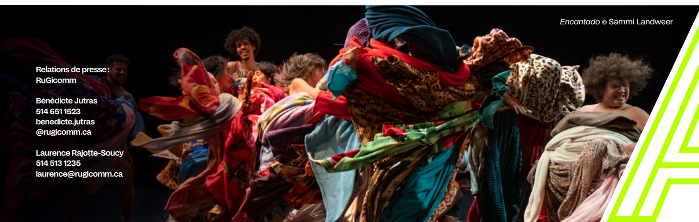
Encantado © Sammi Landweer