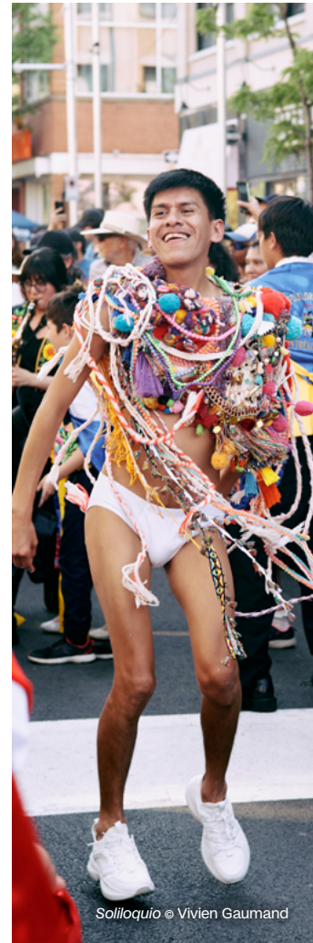
Soliloquio